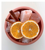
Orangen, Zimt, Anis

BEI KRÄUTERN, DIE LEICHT BRÖSELN, EMPFEHLEN WIR EINEN TEEBEUTEL: