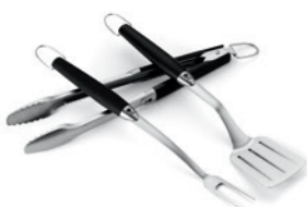
Grillbesteck 3-teilig aus Edelstahl

Generell können Sie alle Weber Grillbestecke in der Spülmaschine reinigen. Das Weber Wok Besteck aus Buchenholz bitte ausschließlich mit der Hand spülen und nicht einweichen.