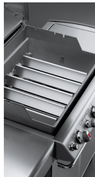
Flavorizer Bars Aromaschienen

Insbesondere Grillroste und Flavorizer Bars Aromaschienen sind hohen thermischen Belastungen ausgesetzt. Fett und andere herabtropfende Flüssigkeiten brennen sich bei hohen Temperaturen in emaillierte oder auch Edelstahlflächen ein. Oberflächige Korrosion entsteht durch unmittelbare Hitze einwirkung und ist kein Qualitätsmangel. Es handelt sich hierbei um normale Gebrauchsspuren.