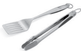
Grillbesteck Weber Style 2-teilig aus Edelstahl