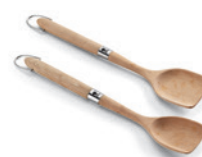
Wokbesteck-Set 2-teilig aus Buchenholz