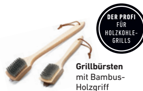
Grillbürsten mit Bambus-Holzgriff