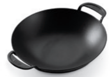
Gourmet BBQ System – Wok Einsatz