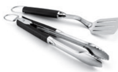
Grillbesteck Kompakt 2-teilig aus Edelstahl