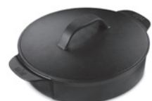
Gourmet BBQ System – Dutch Oven Grilleinsatz