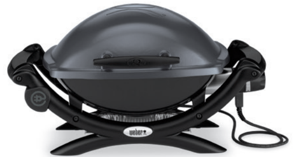
Weber Q 1400, Dark Grey

Bitte hierzu unbedingt die dem Grill beiliegende Bedienungsanleitung beachten! Grobe Verschmutzungen können Sie einfach mit einem Küchenwender oder einem Spatel aus Holz oder Plastik entfernen.