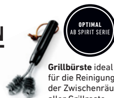
Grillbürste ideal für die Reinigung der Zwischenräume aller Grillroste