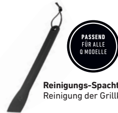
Reinigungs-Spachtel zur Reinigung der Grillkammer