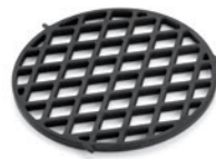
Gourmet BBQ System – Sear Grate Einsatz