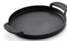
Gourmet BBQ System – Pfannen Einsatz

Vor der ersten Benutzung: Reinigen Sie die gusseisernen Einsätze gründlich mit heißem Wasser, Spülmittel und einem rauen Küchenschwamm. Trocknen Sie die Einsätze gründlich ab. Reinigen Sie nach der Verwendung die Einsätze mit heißem Wasser, Spülmittel und einem rauen Küchenschwamm. Achtung: Verwenden Sie keine Küchenschwämme mit metallischen oder keramischen Scheueranteilen! Das kann die emaillierte Oberfläche der Einsätze zerstören. Trocknen Sie die Einsätze gründlich ab. Nicht in der Spülmaschine reinigen. Bürsten Sie den klappbaren Gourmet BBQ Systemrost mit der Weber Edelstahlbürste ab (siehe auch Hinweise zur Pflege Holzkohlegrills).