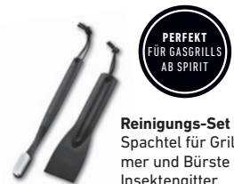
Reinigungs-Set mit Spachtel für Grillkammer und Bürste für Insektengitter