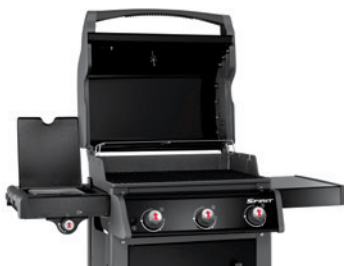
Spirit E-320 Original mit geöffnetem Deckel

Auf der Innenseite des Deckels haftet mit der Zeit Fettdunst an. Dieser lässt sich an dem noch warmen Deckel am leichtesten mit dem Weber Grillreiniger, heißem Wasser und einem rauen Küchenschwamm reinigen. Bei Ihrem Grill blättert Farbe an der Innenseite des Deckels ab? Die Weber Gasgrills der Serien Spirit, Genesis und Summit sind emailliert oder aus Edelstahl. Es ist keine Farbe oder eine andere Beschichtung aufgetragen. Was jedoch abblättern kann, sind anhaftende Fettreste, die mit der Zeit verbrennen (karbonisiertes Fett). Diese Reste können Sie jedoch wieder durch Einweichen und Reinigen mit fettlösenden Mitteln und heißem Wasser entfernen.