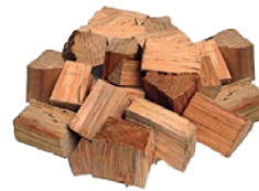
Holzstücke – Wood Chunks

Bei längeren Garzeiten sollten Sie das Grillgut in einen kleinen Bratenkorb geben oder den Bratenrost mit Hitzeschild verwenden. Achten Sie darauf, dass der Grill in einem windgeschützten Bereich steht.