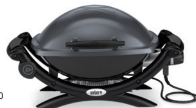
Weber Q 1400

Stellen Sie den Grill in einem windgeschützten Bereich auf. Ansonsten folgen Sie bitte den Empfehlungen wie für Gas- und Holzkohlegrills beschrieben.