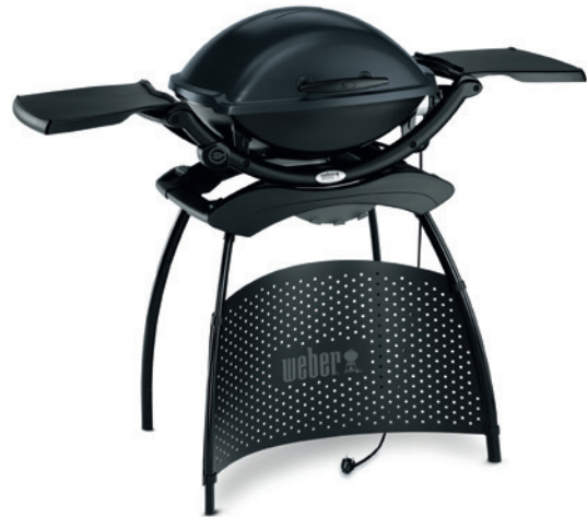
Weber Q 2400 Stand

Bei kurz gegrilltem Fleisch, Fisch oder Gemüse warten Sie, bis sich zunächst der Rauch entwickelt hat. Legen Sie erst danach das Grillgut auf den Grillrost und schließen dann sofort den Deckel. Auf dem Grillrost können Sie Chips oder auch Chunks verwenden.